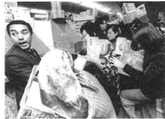
買い占めに殺到する消費者（1973年）

1973年の * オイルショック（石油危機）のときにトイレットペーパーの買い占めが起きたんだよ。